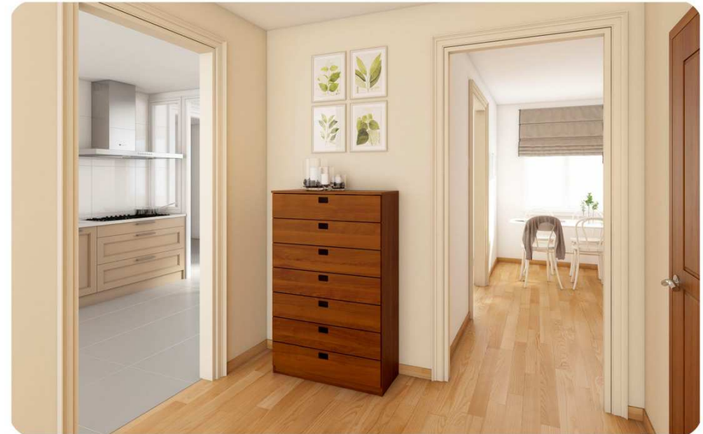
ref. OI7000.01 EAN 8422341201199 7 portes, 28 paires Produit emballé 161x36x15cm.